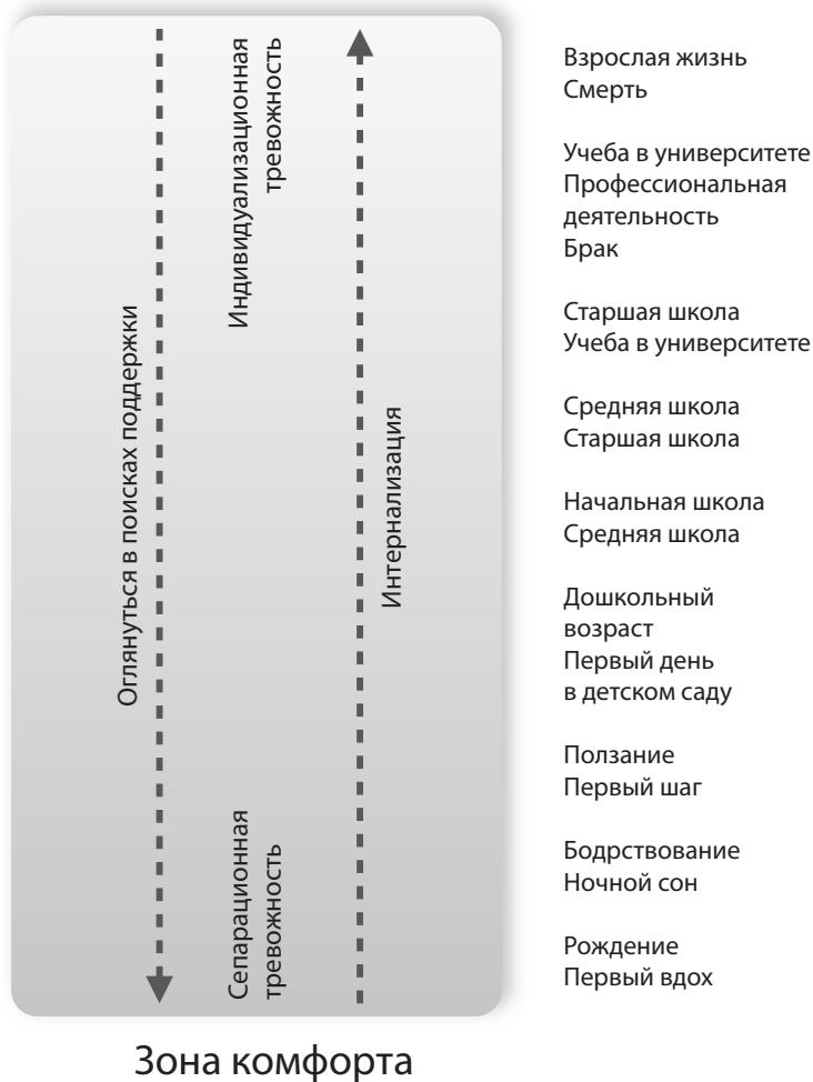
Рис. 2.1. Развитие личности